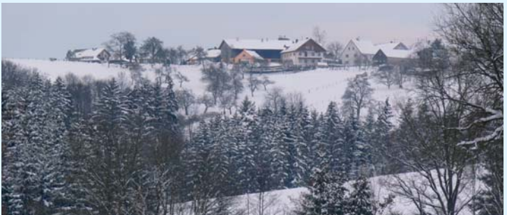
Eigenzell im Winter