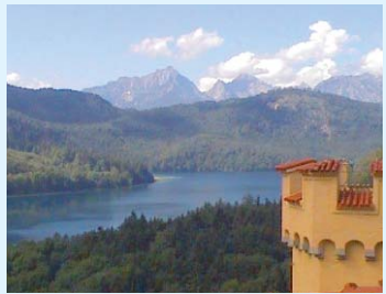
Alpsee im Ostallgäu