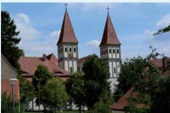
Münster in Heidenheim

In 90 Minuten zeigen uns die Referenten Natur und Kultur von Nordvietnam, Kambodscha und Laos. Sie entführen uns in die Ha-Long-Bucht, zum Kloster Ta Prohm und zu den Pilgerhöhlen