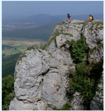
Breitenstein am »Albrauf«

Vom Bahnhof Ellwangen starten wir um 7:30 Uhr mit der Bahn nach Würzburg. Von hier geht es über das Käppele und Kist nach Gerchsheim. Am zweiten Tag