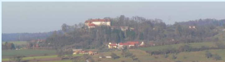
Die Tannenburg bei Bühlertann

Mit PKW fahren wir nach Geifertshofen. Hier unternehmen wir eine schöne Rundwanderung von ca. 2 Stunden, immer mit Blick auf die Tannenburg. Abkürzung ist möglich.