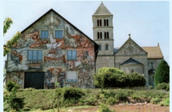
Pfarhaus und Kirche von Hohenberg