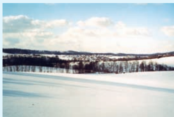
Von Schwabsberg nach Ellwangen