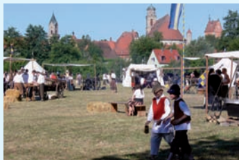
Im Lager der Schweden

Standort und exakter Termin werden in der Tagespresse rechtzeitig bekanntgegeben