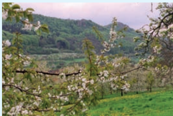
Kirschblüte bei Egloffstein

Anmeldung ist wie immer in der Buchhandlung Bucher möglich. Termin wird in der Stadtinfo und der Tagespresse bekanntgegeben. Reiseleitung: Rüdinger / Burr