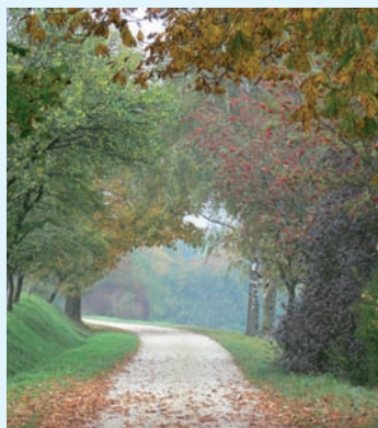
Auf dem HW1 bei Hülen